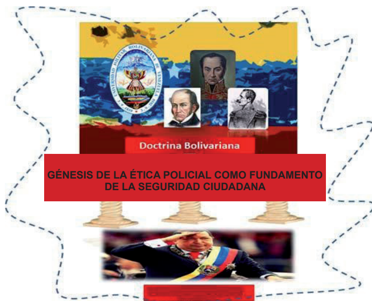
Figura 2. Reproducción Social y liderazgo transformacional de las instituciones policiales: Aprehensión de las resignificaciones socio ética del episteme doctrinario revolucionario bolivariano de Venezuela.

A continuación se ilustra la aproximación a la construcción teórica para la comprensión de la realidad de las instituciones policiales desde las intersubjetividades de los miembros que la componen comandantes y subalternos, ante un hábitus doctrinario emergente.