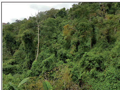
Siembra de café orgánico para la protección de microcuencas en Pasatiempo, Carrizal.