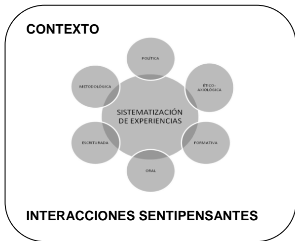
Gráfico 1. Dimensiones de la sistematización de experiencias. Elaboración propia.

Algunos autores (Jara, 1994; Palma, 1992; Cendales, 2002; Verger, 2002; entre otros) han coincidido en señalar que efectivamente existe una práctica investigativa específica llamada sistematización de experiencias. Esta especificidad ha sido explicada en relación con las diferencias encontradas entre ésta y la investigación o la evaluación. No obstante, creo conveniente ahondar en la especificidad de esta práctica a partir de ella misma, del esbozo de las dimensiones que la configuran y hacen de ella una propuesta singular. Como resultado de las lecturas realizadas, he podido identificar algunas de esas dimensiones, las cuales paso a describir a continuación: