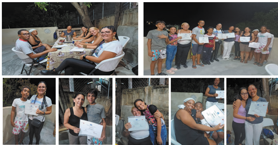
Figura 10. Equipo de educadores populares y entrega de reconocimiento por parte de la Universidad Nacional Experimental Simón Rodríguez (2021-2023)