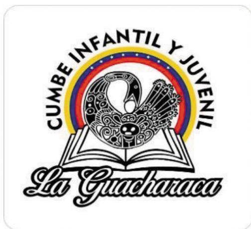
Figura 1. Logo del cumbe infantil y juvenil la guacharaca.

Desde el punto de vista simbólico, filosófico e identitario, se adoptó el símbolo del ave Sankofa, que representa al pueblo Akan de África por su parecido a la guacharaca y por el sentido libertario que ambas aves representan; es importante considerar que el ave sankofa tiene el cuello invertido hacia su cuerpo, significando la búsqueda identitaria y un huevo en la boca (el futuro) comprende tres (3) dimensiones ontológicas centradas en el tiempo: conocer el pasado para comprender el presente y dimensionar el futuro. El diseño de esta ave conjuga elementos simbólicos interétnicos africanos, venezolanos e indígenas, en su cuerpo representando por la bandera de Venezuela, la diosa de la lluvia y un libro para descolonizar la conciencia (Ver Figura 1).