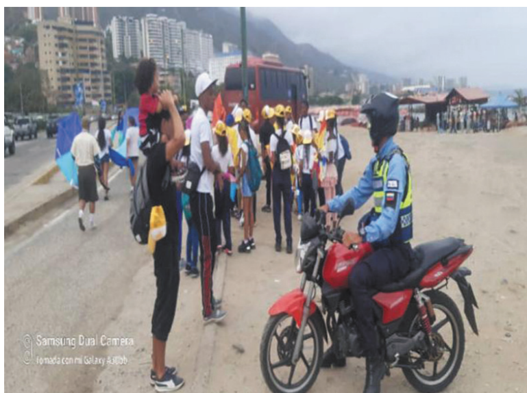
Figura 6 y 7 Toma afroartivismo ecológico (2023)