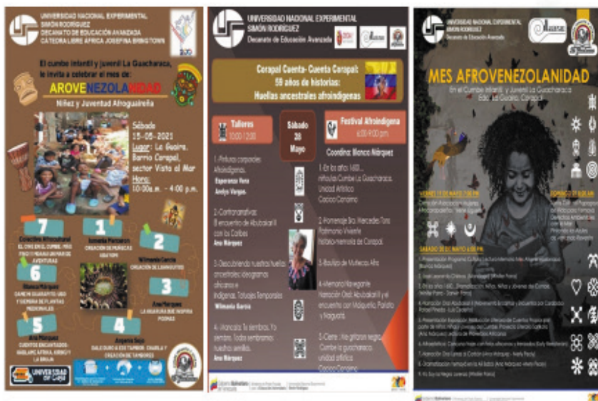
Figura 8. Afiches de invitación para la celebración del mes de la afrovenezolanidad (Mayo) 2021 al 2023.

A continuación, se presentan las tres (3) actividades que han sido desarrolladas en el lapso establecido para esta sistematización (Ver Figuras 8 y 9).