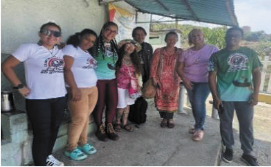
Figura 11. Equipo de educadores populares 2025