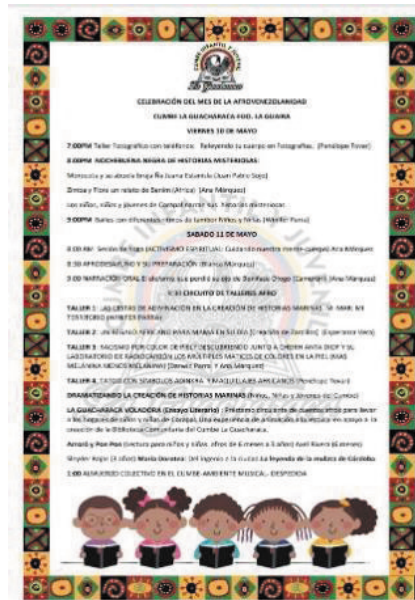
Figura 9. Los puntos de llegada: Reencontrarnos para repensarnos