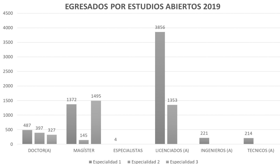
Gráfico 1. Sistematización numérica de los egresados del PROEA UNESR.